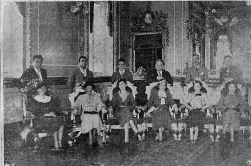
Esta foto muestra en el foyer del Teatro Nacional a las señoritas reinas de belleza con los seis jurados en la sesión conjunta que tuvieron en la tarde de ayer

Ud. no debe indigestarse esta noche.—Coma bien. Saboree sus licores: