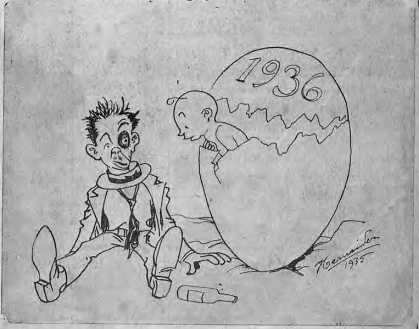
Gritos, alcohol y trompadas a todo pasto. A esto le llaman "Fiestas cívicas" y decían mi tatarabuelo que cuando nos descubrió Colón ya las fiestas cívicas eran así!