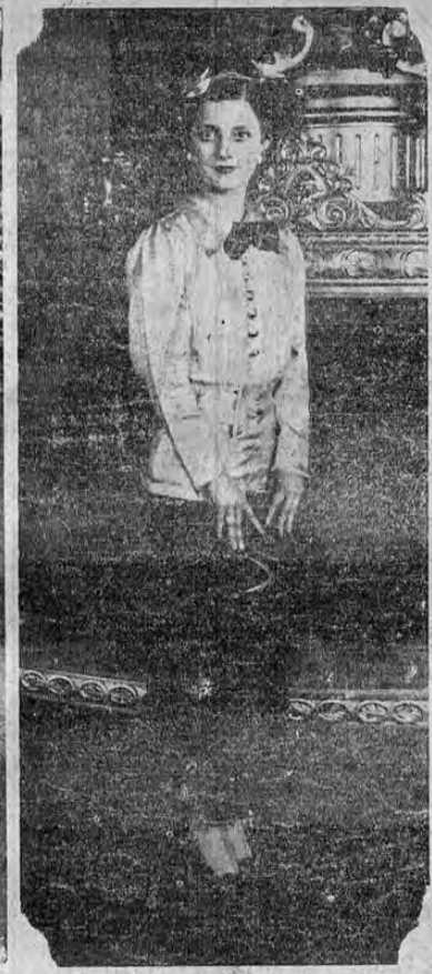
Señora EL SALVADOR