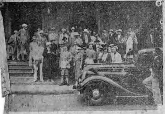
El grupo de 57 turistas que ingresó ayer a esa capital, y que hoy de regreso a los Estados Unidos.