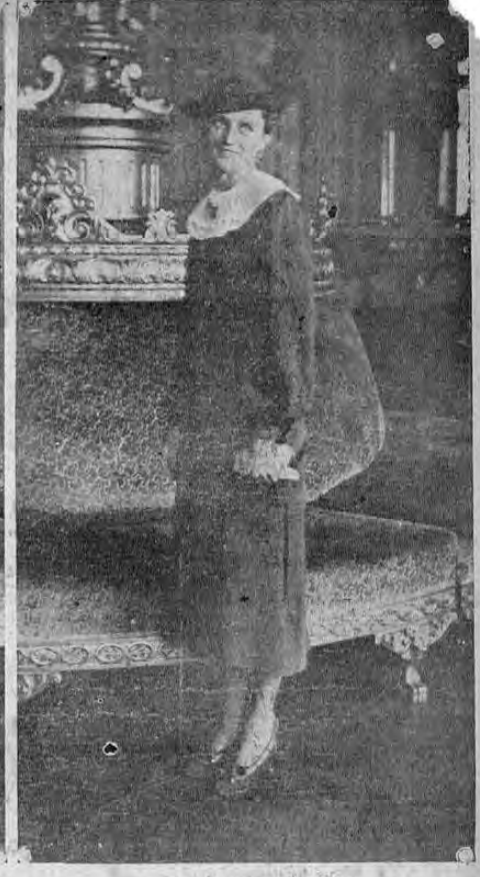
Señora CANAL ZONE