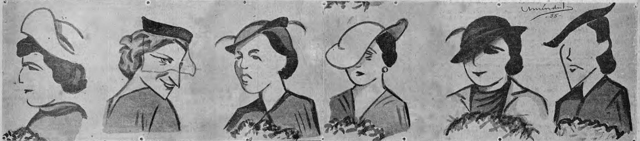
MISS COSTA RICA