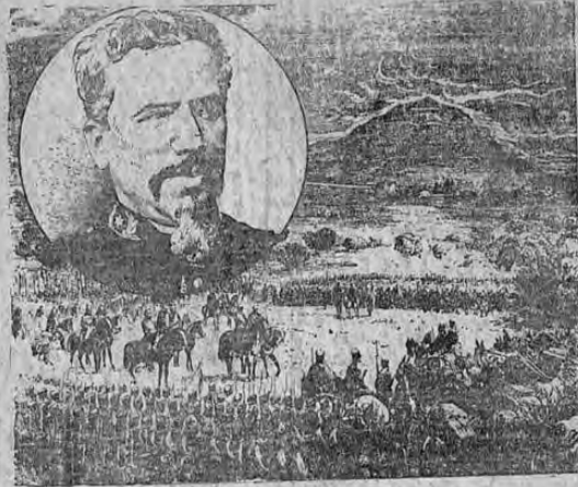
Proclamación de Alfonso XII en Sagunto el 29 de diciembre de 1874. En el círculo: El general Martínez Campos en la época a que se refiere este episodio.