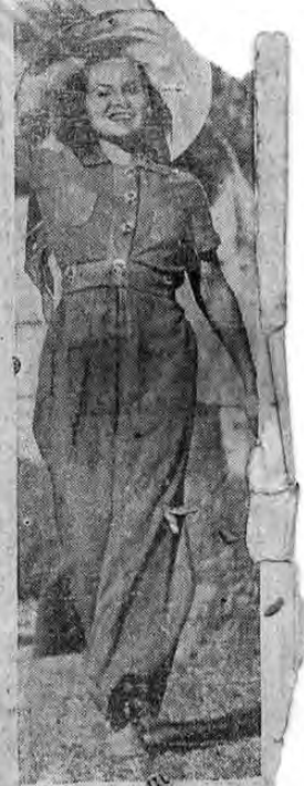
Después de trabajar con Chaplin en la película "Tiempos Modernos", Paulette Goddard pasa un momento en el campo, en compañía de los hijos del genial actor de la pantomima. La sonrisa que Paulette luce en esta instantánea, tomada durante uno de sus paseos campestres, refleja la satisfacción de que goza la actriz después de haber contribuido a crear la última obra de arte de la pantalla.